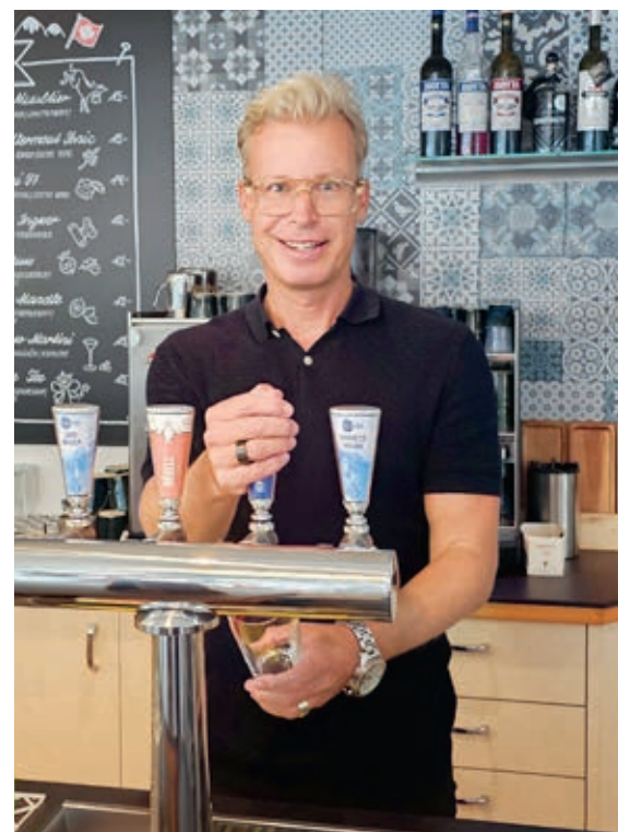
Getränke zapfen im Lokal 97