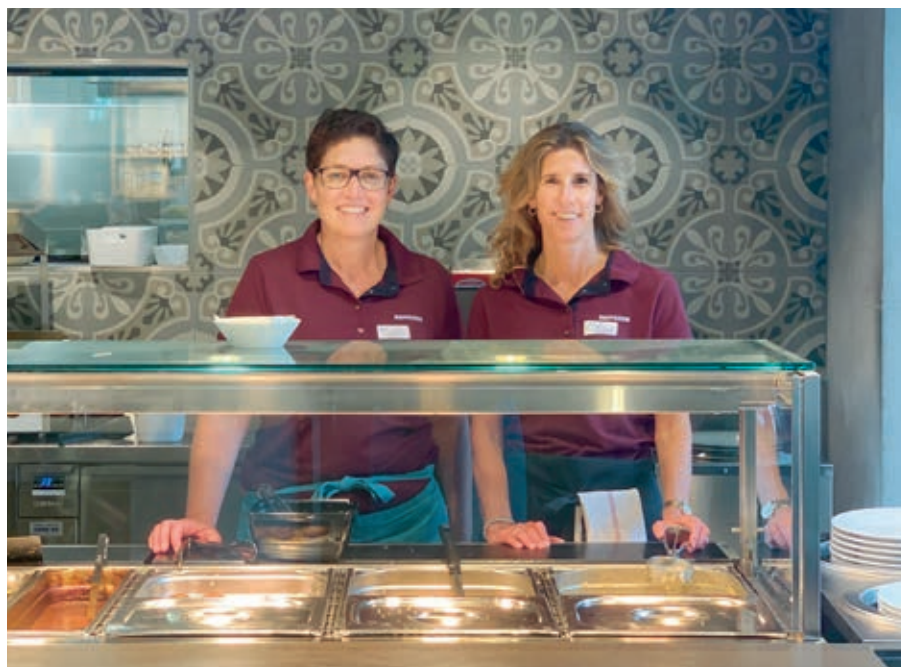
Essensausgabe im Restaurant Story