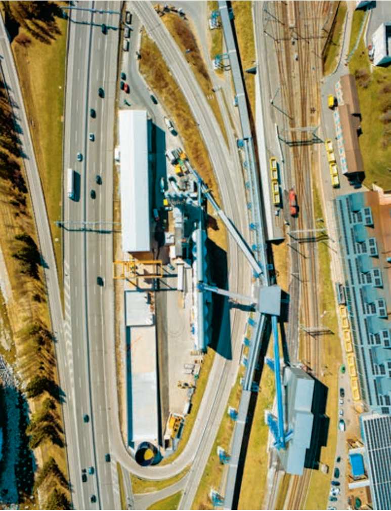
Ein echtes Gemeinschaftsprojekt, welches Menschen verbindet: der Bau des zweiten Gotthard-Strassentunnels.