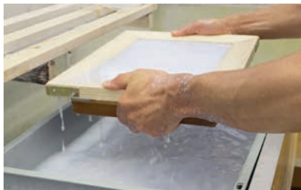
Papierschöpfen bei ConSol