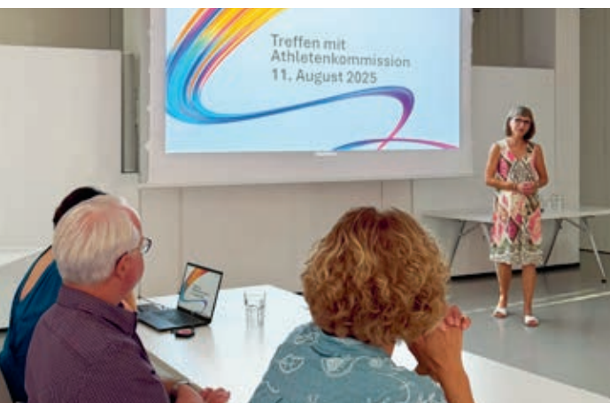
Athletenkommissionssitzung vom 11. August 2025 in der zuwebe.

Es war ein Treffen voller Emotionen, Inspiration und Vorfreude – ein weiterer Schritt auf dem Weg zu unvergesslichen National Summer Games 2026.